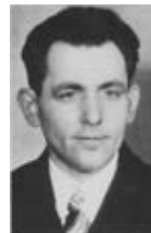
Projektgruppe Georg-Elser-Denkmal Hermaringen

Die nächste Gemeinderatssitzung findet nicht am 14.11.2024, sondern am 21.11.2024 um 18:00 Uhr im Sitzungssaal des Rathauses statt.