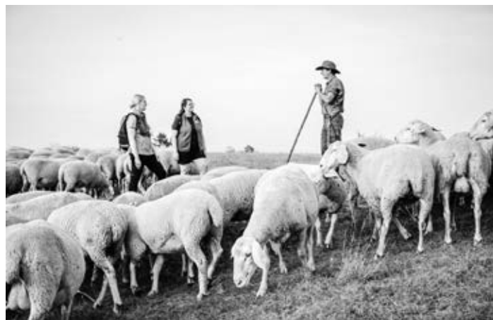
Wanderinnen mit Schäfer

Alle Produkte können außerdem beim Tourismus-Team des Landratsamtes vorbestellt und persönlich abgeholt werden (Telefon 07321 321-2593 oder E-Mail info@heidenheimer-brenzregion.de ). Weitere Informationen und Details zum Albschäferweg sind unter www.heidenheimer-brenzregion.de abrufbar.