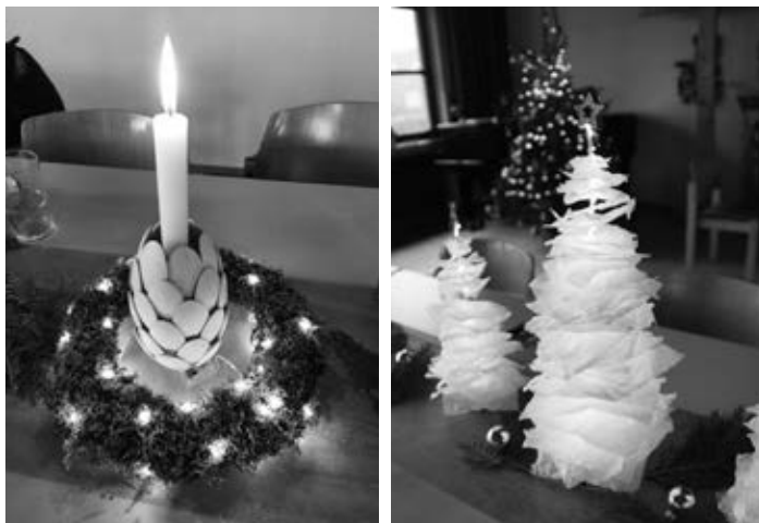
Unsere festliche Weihnachtsdeko 2025

Kaffee und Kuchen durften natürlich auch an diesem Nachmittag nicht fehlen, so dass am Ende alle satt und zufrieden wieder nach Hause zurückgekehrt sind. Zum Abschied hatten wir – wie bereits im Vorjahr – noch ein kleines Geschenk