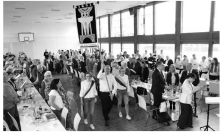
Zum Auftakt des Treffens der ostwürttembergischen Gesangsvereine „zieht“ das EJC-Banner in die Versammlung ein.

Diese 133. Generalversammlung in der Hermaringer Güssenhalle wird einen besonderen Platz in der Chronik bekom-