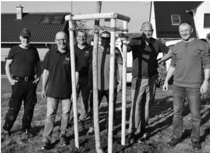
Der Obst- und Gartenbauverein mit dem Bauhof.

Die Gemeinde möchte sich ganz herzlich beim Obst- und Gartenbauverein sowie den Kindergartenkindern mit ihrem Erzieherinnenteam für die Unterstützung des Gemeindebauhofs bei der Pflanzung der Bäume und bei der Mitgestaltung dieser Veranstaltung bedanken.