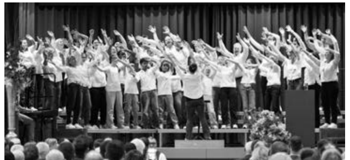
Voices & Fun