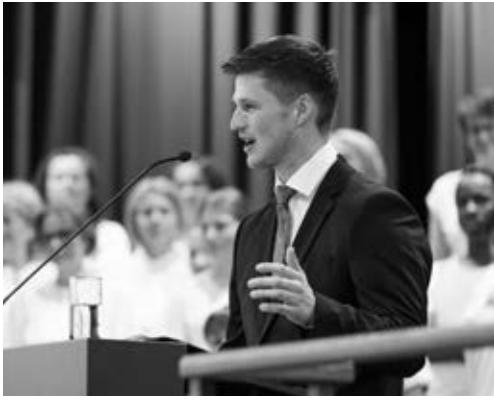
Bürgermeister Lennart Schmeißer

stände seines Wahlsieges bei seiner Wahl am 1. Februar dieses Jahres, „Dieses Ergebnis gibt mir ordentlich Rückenwind“. Diesen Vertrauensvorsprung werde er nun „Tag für Tag zurückzahlen“, gelobte er. Die Geschicke einer Gemeinde