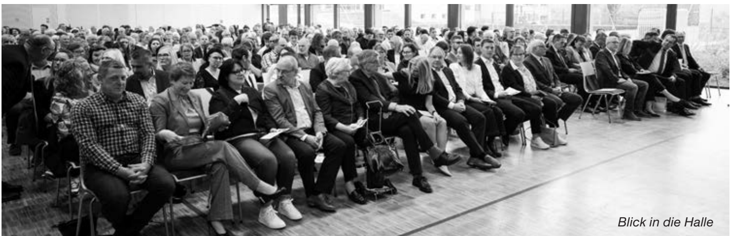
Blick in die Halle