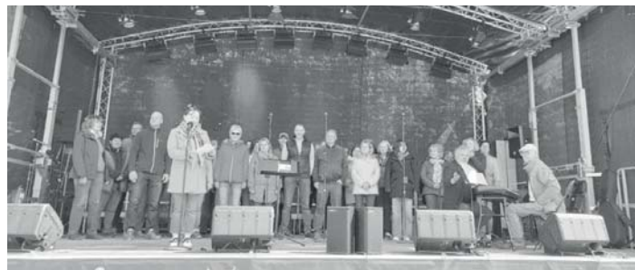
Voices & Fun