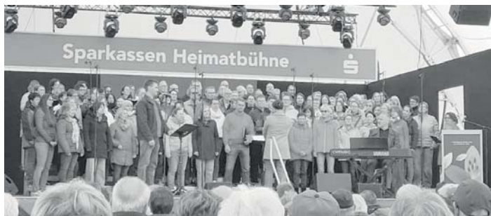
Auftaktveranstaltung mit Voices & Fun

Gleich mit zwei Formationen war der Gesangverein Hermaringen an Christi Himmelfahrt auf der Landesgartenschau vertreten: dem eigens hierfür gegründeten Projektchor sowie dem Chor Voices & Fun. Damit präsentierte sich der Verein eindrucksvoll dem Publikum.